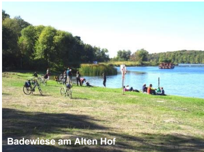
Badewiese am Alten Hof