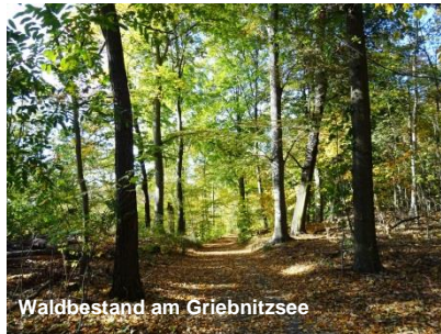
Waldbestand am Griebnitzsee